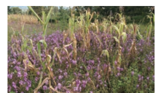
ストライガ(紫色の花をつけた植物)に寄生されたトウモロコシ