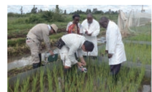
圃場における調査の様子 (ケニア・ムエア灌漑地区)