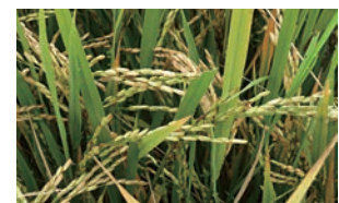
冷害を受けたイネの穂 (ケニア・ムエア灌漑地区)