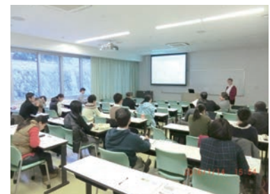
オープンセミナーでは様々な国からの講師が講演

開発のための農学研究や国際協力に関わっている専門家などに講演していただいています。また、当センターが現在実施している研究活動などについて、年4回ほどメールマガジンを配信しています。