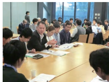
オープンフォーラムでのグループディスカッション

当センターでは、農学分野の国際教育、国際共同研究および国際協力における重要な課題を取り上げ、テーマに造詣の深い研究者や実践者を国内外から講師として招待し、大学関係者だけでなく一般市民も参加できる形式でオープンフォーラムを時機に応じて開催しています。また、研究者や学生、一般市民を対象とするオープンセミナーを年に数回開催し、途上国における