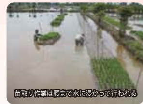
苗取り作業は腰まで水に浸かって行われる

私たちは、半島マレーシア西岸やスマトラ東岸地域の低湿地において行われてきた多回移植栽培を改めて技術的に評価するとともに、現地で栽培されてきたイネ品種の冠水に対する生育反応の調査を通じ、水深と深水期間が異なる地域で冠水への適応として稲体が具備すべき形質を明確にして、伝統的な技術を基本として洪水常襲地における稲作の安定化を目指し、冠水ストレスの軽減と被害からの回復を促すための肥培管理の改善など栽培技術の高度化に取り組んでいます。