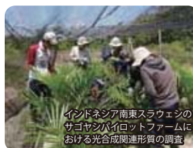
インドネシア南東スラウェシのサゴヤシパイロットファームにおける光合成関連形質の調査