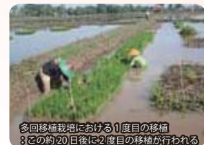
多回移植栽培における1度目の移植 ：この約20日後に2度目の移植が行われる