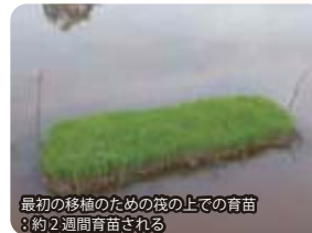
最初の移植のための筏の上での育苗 ：約2週間育苗される