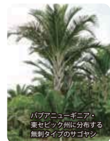
バブアニューギニア・東セビック州に分布する無刺タイプのサゴヤシ

私達の研究室では、サゴヤシがどのようにして塩害土壌や酸性土壌に適応しているか、そのメカニズムの解明に取り組むとともに、フィールドでの生育追跡調査を通じてサゴヤシの安定的栽培管理技術の開発に当たっています。また、国際共同研究としてリモートセンシングによる生育面積の推定と栽培適地の抽出、デンプン抽出残渣から甘味料を作り出す技術の開発、新技術が社会経済に与えるインパクトの推定に取り組んでいます。