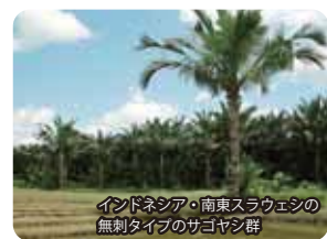
インドネシア・南東スラウェシの無刺タイプのサゴヤシ群