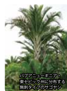
パプアニューギニア・東セビック州に分布する無刺タイプのサゴヤシ

私達の研究室では、サゴヤシがどのようにして塩害土壌や酸性土壌に適応しているか、そのメカニズムの解明に取り組むとともに、フィールドでの生育追跡調査を通じてサゴヤシの安定的栽培管理技術の開発に当たっています。また、国際共同研究としてリモートセンシングによる生育面積の推定と栽培適応地の抽出、デンプン抽出残渣から甘味料を作り出す技術の開発、新技術が社会経済に与えるインパクトの推定に取り組んでいます。