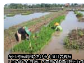
多回移植栽培における1度目の移植 この約20日後に2度目の移植が行われる