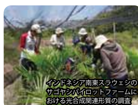
インドネシア南東スラウェシのサゴヤシパイロットファームにおける光合成関連形質の調査