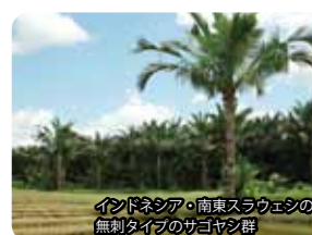
インドネシア・南東スラウェシの無刺タイプのサゴヤシ群