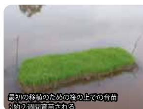
最初の移植のための筏の上での育苗 約2週間育苗される