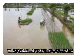
苗取り作業は腰まで水に浸かって行われる

私たちは、半島マレーシア西岸やスマトラ東岸地域の低湿地において行われてきた多回移植栽培を改めて技術的に評価するとともに、現地で栽培されてきたイネ品種の冠水に対する生育反応の調査を通じ、水深と深水期間が異なる地域で冠水への適応として稲体が具備すべき形質を明確にして、伝統的な技術を基本として洪水常襲地における稲作の安定化を目指し、冠水ストレスの軽減と被害からの回復を促すための肥培管理の改善など栽培技術の高度化に取り組んでいます。