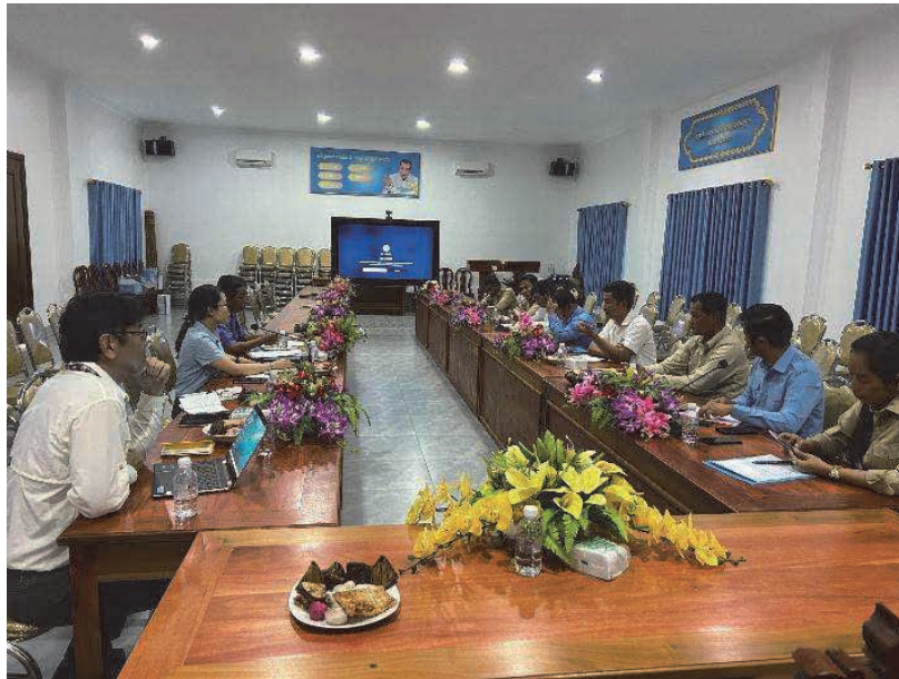
図9 ケップ市役所での会議