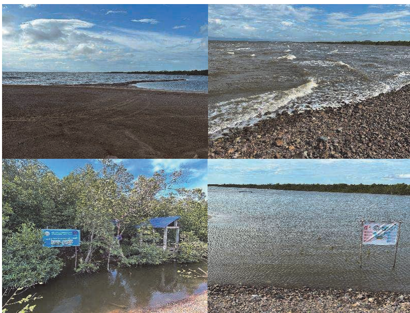
図7 Phone Thmey CFiの様子