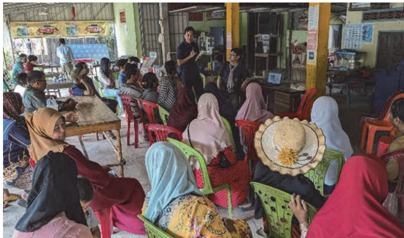
図10 Phone Thmey CFi での説明会