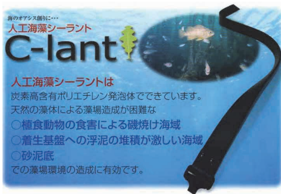
図1 人工海藻 C-lant のカタログ (NETIS 登録番号: CBK-040003)