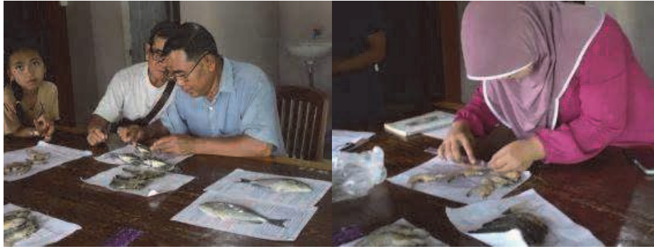
図 16 Phone Thmey CFI でのワークショップの様子

中断されたことを受けて、出稼ぎ労働者が故郷に戻り、漁業を行ったことで、一時的に沿岸小規模漁業では、かなりの過剰漁獲が行われていたとの報告がある *7 。このため、元々この地域において沿岸小規模漁業で生計を立てていた CFI のメンバーは、資源の悪化や環境の劣化を危惧していた。人工海藻による藻場造成と漁業資源へのケアの展開に、ケップ州政府や CFI が協力的であったことには、このような背景が影響しているものと思われる。また、実際に今回実施した人工海藻を用いた藻場造成を契機として、それまで漁業に利用されていなかった海域に新たに人工海藻藻場が形成され、その漁場に多くの海洋生物が蝟集していることが水中画像で確認されたことが、沿岸漁業者の漁労行為に大きく影響したことも確かである。また、最初は数名で開始されて人工海藻藻場周辺での漁業で、漁業従事者の納得がいく量の漁獲が上げられたことが、CFI メンバーのさらなる興味関心を引き出し、自分たちで作上げた新たな漁場を自分たちで管理する意識が生まれることにつながったと思われる。このような資源や環境へのケア *5 を推進する社会意識の変化は、持続的社會への変換を目指してかねてより提案されてきたエリアケイパビリティーアプローチにおける社会変化と一致する 8) 。すなわち今回のように、人工海藻藻場を住民と研究者および行政が協力して設置し、新たな漁場や水産生物の卵稚仔の育成場を整備することで資源と環境をケアし、同時に住民の生活の向上を図る取り組みはエリアケイパビリティーの向上に確実につながっていると推察された。加えて、藻場のモニタリング活動を通じた漁業者と研究者と行政の連携強化は、発展途上国の持続的水産資源利用に向けた Co-management 体制の一層の確立にも貢献できる可能性が示唆された。