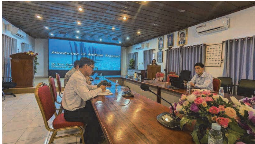
図3 カンボジア水産局での会議風景