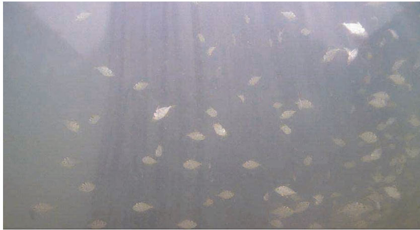
図 12 2024 年 3 月 3 日に回収されたカメラの画像（小魚の蝟集が見られる）