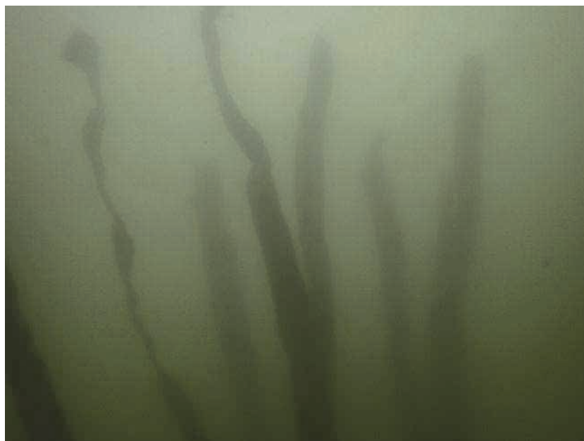
図14 清掃後自立したC-lant