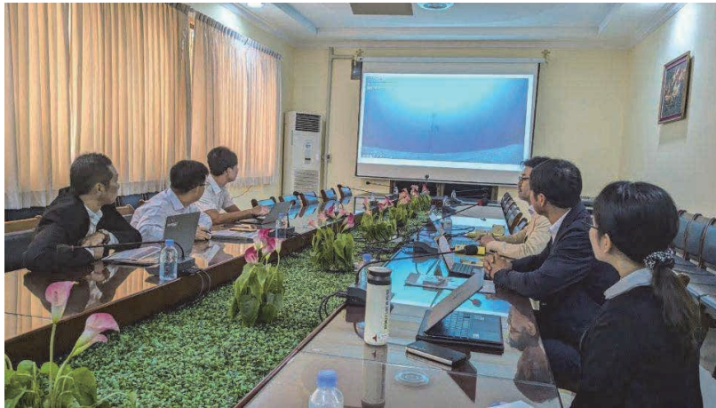
図6 カンボジア王立農業大学水産学部での説明風景