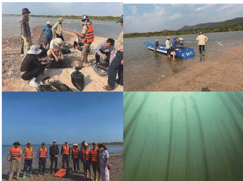
図11 2024年3月のCFiメンバーとのC-lant藻場の設置の様子