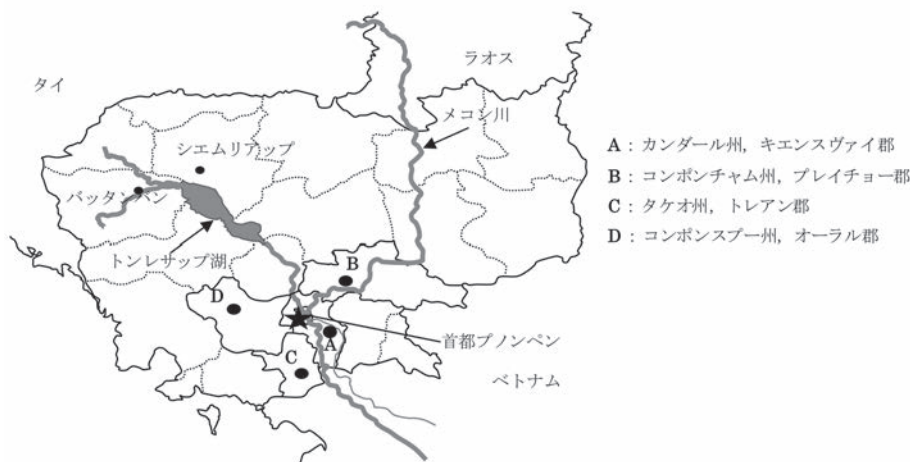
図2 カンボジア全図と研究対象地域の位置 (松本、2007)

蒸留酒の製造については、酒造の副産物である酒粕を餌に用いた養豚を同時に営むことで利益を得ているものの、米蒸留酒の製造のみの経営は他の加工品と比較して最も薄利又は赤字であることが明らかとなった(松本 2007、矢倉他 2010)。カンボジアの養豚は農家の庭先で飼育する小規模なものが殆どだが、近年では外国資本の大規模な養豚場が出現しており、養豚業の独立が進みつつある。現在のように米蒸留酒のみでの経営が成り立たない状況で養豚の独立が進んだ場合、利益が見込めなくなる農家単位での養豚の衰退に伴って、米蒸留酒という伝統的な加工品が消滅する可能性も否めない。そこで、酒造農家の赤字経営を改善・解