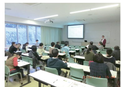
オープンセミナーでは様々な国からの講師が講演