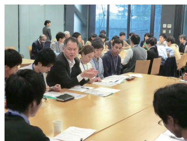
オープンフォーラムでのグループディスカッション

当センターでは、農学分野の国際教育、国際共同研究および国際協力における重要な課題を取り上げ、テーマに造詣の深い研究者や実践者を国内外から講師として招待し、大学関係者だけでなく一般市民も参加できる形式でオープンフォーラムを時機に応じて開催しています。また、研究者や学生、一般市民を対象とするオープンセミナーを年に数回開催し、途上国における開発のための農学研究や国際協力に関わっている専門家などに講演していただいています。また、当センターが現在実施している研究活動などについて、年4回ほどメールマガジンを配信しています。