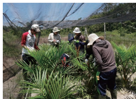
インドネシア南東スラウェシのサゴヤシパイロットファームにおける調査