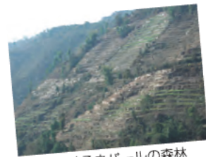
荒廃するネパールの森林

多くの開発途上国では、日々の煮炊きに向う薪炭材の採取が森林減少の一要因として挙げられています。家畜糞尿を用いたバイオガスは、薪炭材の代替品としてNGOや国際機関の支援を通じて多くの開発途上国において急速に導入が進められていますが、薪炭材利用量の削減という効果以外は明確になっていません。本研究では、バイオガスの導入から20年近く経過しているネパールの丘陵地において、バイオガスの導入が薪炭材利用量だけでなく、森林植生、地域住民の生計活動、森林管理体制などに対する正負の影響について、定量的・定性的な実態調査に基づいた分析を行っています。