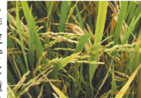
冷害を受けたイネの穂 (ケニア、ムエア灌漑地区)

アフリカ大陸東岸、赤道直下に位置するケニアの稲作では、早ばつ、高地で起こる冷害、インド洋岸の水田における塩害、土壌の低肥沃度、いもち病、イネ黄斑病などの生物的・非生物的ストレスが阻害要因となっています。これらの生産阻害要因を克服し、稲作の安定化と生産性向上を実現することは、ケニアの農業における最重要課題の一つです。近年では、ストレス耐性や作物生産性に関わる様々な形質とそれらに関与する量的遺伝子座 (QTL: Quantitative Trait Locus) が明らかにされ、有用なQTLをテラーメードで導入した品種を開発することが技術的に可能となっています。しかし、実際に圃場で発現するストレス耐性や生産性は、品種のもつ遺伝的要因だけで決まるわけではなく、栽培環境と栽培管理による影響を受けて変化します。当センターでは、日本における人工環境下での栽培試験とケニアにおける現地栽培試験によるG (遺伝子型) ×E (環境条件) ×M (栽培管理) の相互作用の解析を通して、ケニアの栽培環境下で機能するQTLの特定および導入したQTLの機能が有効に働くための条件の解明に取り組んでいます。その上で、上記の様々なストレスに抵抗性や耐性を有する品種の開発を進めるとともに、イネ品種の能力を十分に発現させる栽培技術を開発し、ケニアの稲作の安定化と生産性向上の実現を目指しています。