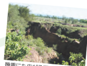
幾重にも広がる深いガリー侵食、 周辺には農家が点在し農業を営む

ケニアでは、土壌侵食が各地で起こり、住民の生活を脅かしています。主要な要因として、土壌、地質や気象等の自然条件が研究されてきましたが、そこで生活する人々のヒューマン・インパクトの影響も大きいと言われていました。そこでこの研究は、ビクトリア湖に近い調査対象地で、侵食土壌の特性評価、ヒューマン・インパクトの解明、危険予測手法の開発、これまでの防止対策の社会科学的評価及び地域資源活用による保全農業のやり方の開発などを目的としています。環境地質、環境情報、土壌肥料、作物生理生態、農業経済、文化人類学の学際的チームで、マセノ大学の民族植物学、作物生理、土壌などの研究者と一緒にフィールドワークを中心とした調査研究を実施しています。