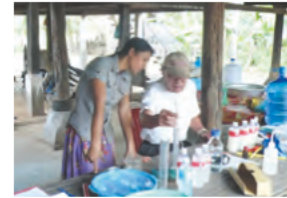
日本人専門家による 酒造農家への技術指導

本研究は、カンボジア王立農業大学(RUA)と協力し、現地の農家と一緒に農産物加工品の開発・品質向上の実践を行うことで農民の生活向上を目指す農村開発モデルの構築を目指しています。2008年度より、カンボジアの伝統的な米焼酎を農産物加工品の一例として、消費者ニーズの把握、品質の向上、商品化、販路の開発を行い、既にカンボジア国内にて流通しています。