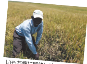
いもち病に感染し枯れ上がった 登熟期のイネ (ケニア・ウエストカノ灌漑地区)

ケニアの主要な稲作地帯では、いもち病が多発し、コメ生産が半減する等大きな問題となっています。いもち病が問題となっている地域では、共通して単一品種の連続栽培が行われています。単一品種の大規模連続栽培が行われると、その品種を侵害できるいもち病菌レースが出現・増殖し、いもち病抵抗性の崩壊が起こると考えられています。本研究では、ケニアにおいて、いもち病菌菌系の病原性やイネ品種の抵抗性遺伝子型を同定することのできる判別システムを構築し、いもち病防除技術の開発を進めるため、ケニア各地の栽培イネ品種と栽培体系の把握、ケニアのイネ品種のいもち病抵抗性遺伝子型の同定、いもち病菌レースの多様性の解明、いもち病抵抗性QTLを導入した系統の耐病性の検証に取り組んでいます。