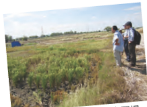
フィリピンの天水田農家圃場

世界のイネ栽培面積の約3分の1が、降雨に依存して栽培する天水田栽培によるものです。天水田栽培において問題となるのが、イネの生産性低下の主要な要因である乾燥ストレスです。したがって、耐旱性イネ品種の開発は、焦眉の課題です。本研究では、耐旱性イネに必要な形質の同定とその機能解析を、根に注目して進めています。また、対象天水田地域における気象と土壌の環境条件を把握した上で、有用形質と環境要因との相互作用を評価します。この研究を通して、耐旱性イネ品種育成に必要な基礎的知見の提供を目指します。