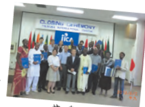
やったー。 笑顔にあふれる修了式

JICAの集団研修コース「アフリカ地域 稲作振興のための中核的農学研究者の育成」を2012年度から3年間実施しています。全体で約1ヶ月のコースで、中核研究者として最低限必要不可欠な素養を身につける「コア研修」と当該国の稲作振興のための課題解決に必要な具体的な研究計画案の作成を目指す「個別研修」とで構成されています。2013年度の「個別研修」では、名古屋大学、岩手大学、山形大学、新潟大学、茨城大学、京都大学及び三重大学の7大学が協力の上、各研修員の個別ニーズに基づいたオーダーメイドの研修を提供しました。研修員は、稲作に関する様々な地域共通課題を解決するために必要な研究手法やノウハウを習得し、アフリカ地域の稲作振興に貢献することが期待されています。