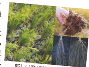
新しい育種法を駆使した ストレス耐性品種の育成

作物育種に活用されてきた遺伝子組換え技術は21世紀に入ってからも多様な技術が次々に開発され、近年には従来の遺伝子組換えの痕跡が残る技術から、最終産物である品種のゲノム中には痕跡が全く残らない技術が開発されるに至っています。New Plant Breeding Techniques (NBT)と称されるこれらの技術は世界的に非常に関心が高まっており、これを代表する技術に人工制限酵素を利用したゲノム編集が挙げられます。我々は上記で明らかとなった根系形態を改良する上で利用可能な遺伝子座に注目し、このNBTを活用して根系形態の改変を可能にする新たな有用遺伝子を創出することを目指しています。