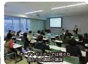
オープンセミナーでは様々な国からの講師が講演