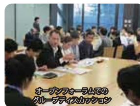
オープンフォーラムでのグループディスカッション

本センターでは、毎年農学教育と国際協力の両分野における重要な課題を取り上げ、テーマに造詣の深い研究者や実践者を国内外から講師として招待し、大学関係者だけでなく一般市民も参加できる形式でオープンフォーラムを開催しています。また、途上国で国際協力に関わっていた農学分野の専門家などを講師として、農学国際協力に関心を持つ研究者や学生、一般市民を対象に年に数回、オープンセミナーを実施しています。