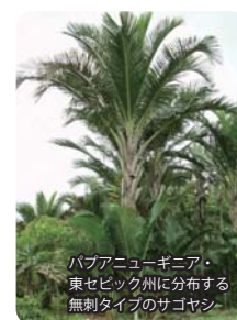
バブアニューギニア・東セビック州に分布する無刺タイプのサゴヤシ

私達の研究室では、サゴヤシがどのようにして塩害土壌や酸性土壌に適応しているか、そのメカニズムの解明に取り組むとともに、フィールドでの生育追跡調査を通じてサゴヤシの安定的栽培管理技術の開発に当たっています。また、国際共同研究としてリモートセンシングによる生育面積の推定と栽培適地の抽出、デンプン抽出残渣から甘味料を作り出す技術の開発、新技術が社会経済に与えるインパクトの推定に取り組んでいます。